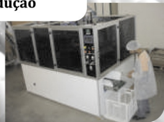
Projeto e Desenvolvimento